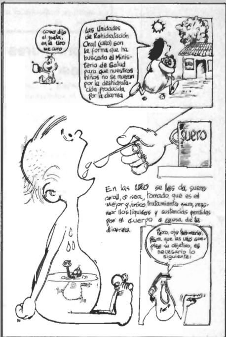
NICARAGUA: Causes of diarrhoea and how to prevent it (sample pages).